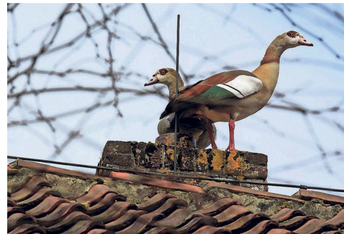
Een paartje Nijlganzen op het dak van de boerderij in de Leidse Hout.

Hoe dieren reageren op de mens, blijkt ook als we een tijd naar de herten staan te kijken. Een roodborst komt poolshoogte nemen, vlak langs ons vliegt een koolmees die boven ons op een tak gaat zitten en vlakbij op het hek strijkt een kauwtje neer om ons aandachtig op te nemen. Van der Sluis: „Jouw gedrag bepaalt of je vogels ziet.”