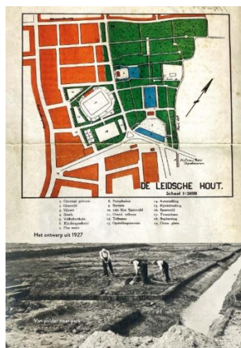
Voorproefje boekje vijf

Zie voor meer informatie en alle data voor 2026 de startpagina van de website.