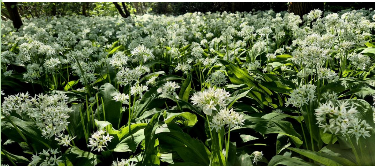
Daslook in het park.

Jubileumconcert tegen gereduceerde prijs in het Openluchttheater Leidse Hout met Collegium Musicum uit Leiden.