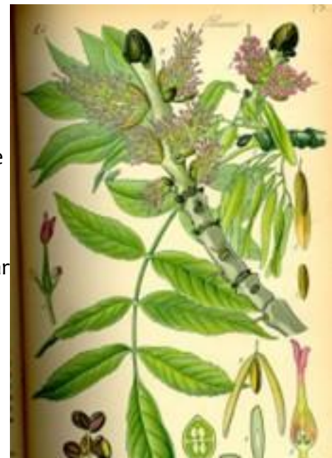
Flora von Deutschland, Österreich und der Schweiz, 1885

Wie dus rond het (beginnende) voorjaar tegen de avond in de Leidse Hout gaat wandelen, loopt de kans niet alleen een bosuil maar ook vliegende essen tegen te komen.