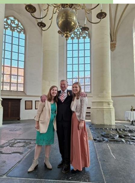
Ton met zijn dochters in de Hooglandse Kerk.